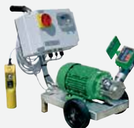
远程变频控制泵的流量