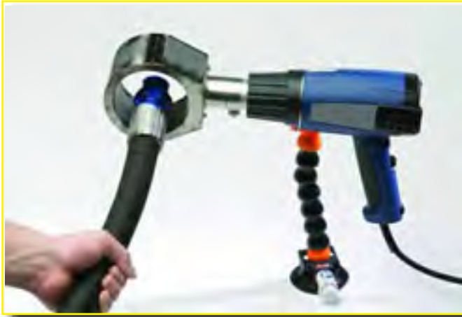
上图UC-HL1910E热风枪, UC-HG枪座, UC-1.5HD热风罩均可单独购买