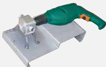
连接手枪电钻驱动