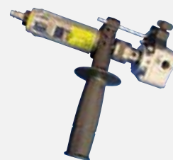
连接风动工具驱动